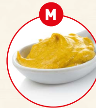
M SENF UND DARAUSS GEFÜGELT ERZEUGNISSE