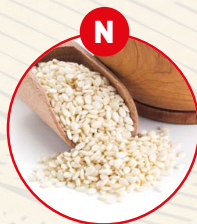
N SESAMSAMEN UND DARAUSS GEFÜGELT ERZEUGNISSE