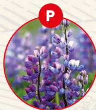
P LUPINEN UND DARAUSS GEFÜGELT ERZEUGNISSE