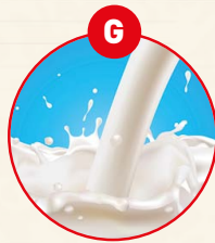
G MILCH VON SÄUGETIEREN UND MILCHERZEUGNISSE (INKLUSIVE LAKTOSE)