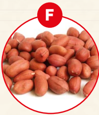
F SOJABOHNEN UND DARAUSS GEFÜGELT ERZEUGNISSE