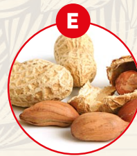
E ERDNÜSSE UND DARAUSS GEFÜGELT ERZEUGNISSE