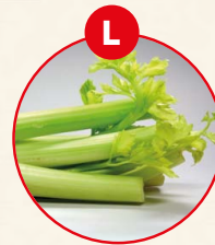
L SELLERIE UND DARAUSS GEFÜGELT ERZEUGNISSE