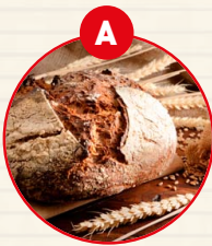
A GLUTENHALTIGES GETREIDE UND DARAUSS GEFÜGELT ERZEUGNISSE

„Trotz sorgfältiger Herstellung unserer Gerichte können neben gekennzeichneten Zutaten Spuren anderer Stoffe enthalten sein, die im Produktionsprozess in der Küche verwendet werden.“