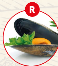
R WEICHTIERE WIE SCHNECKEN, MUSCHELN, TINTENFISCHE UND DARAUSS GEFÜGELT ERZEUGNISSE