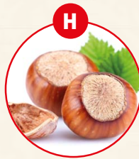
H SCHALENFRÜCHTE UND DARAUSS GEFÜGELT ERZEUGNISSE