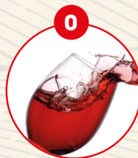
O SCHWEFELDIOXID UND SULFITE