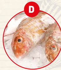
D FISCH UND DARAUSS GEFÜGELT ERZEUGNISSE (AUSSER FISCHGELATINE)