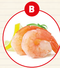
B KREBSTIERE UND DARAUSS GEFÜGELT ERZEUGNISSE